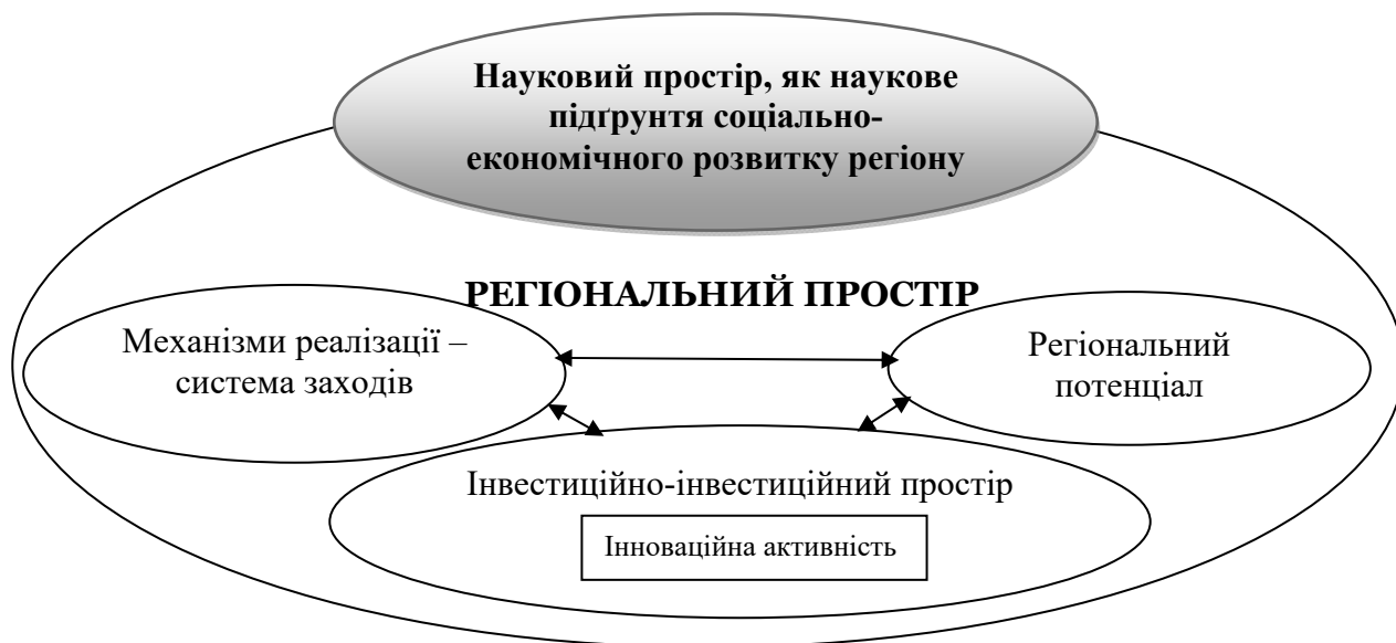
Рис. 1. Просторовий вимір системи механізмів реалізації ОУІ в регіоні

Впровадження і реалізація механізмів реалізації системи ОУІ у соціально-економічному розвитку регіону має здійснюватися через реалізацію комплексу окремих специфічних механізмів, організаційних та управлінських заходів, які будуть здійснюватися суб'єктами регіонального розвитку відповідно до затвердженого плану реалізації стратегії та інших регіональних програм, а також рішень органів місцевого самоврядування (рис.1). Формування такого механізму складається з взаємопов'язаних елементів, які включають мету, завдання, планування, аналіз, оцінку, прийняття рішень, що спрямовані на розвиток регіону, та реалізацію стратегічної платформи, яка містить соціально-економічний аналіз, SWOT-аналіз, визначення і відбір конкурентних переваг, визначення концепції (бачення) розвитку і стратегічних цілей, яка дозволяє збалансувати взаємно суперечливі вимоги для досягнення результатів у короткостроковій і довгостроковій перспективі. Мета формування та запровадження системи механізмів реалізації ОУІ полягає у створенні активного середовища як дієвої системи та взаємодії стейкхолдерів соціально-економічного розвитку регіонів, які його забезпечують, які повинні гнучко реагувати на можливі зміни ситуації в регіоні.